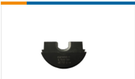
TE 产品编号1-1490413-8 NEST, 90 DEG SOLISTRAND1/0