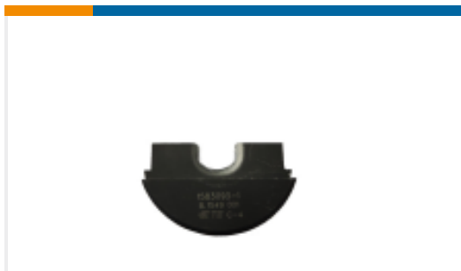
TE 产品编号1-1490413-6 NEST, 90 DEG SOLISTRAND, 4