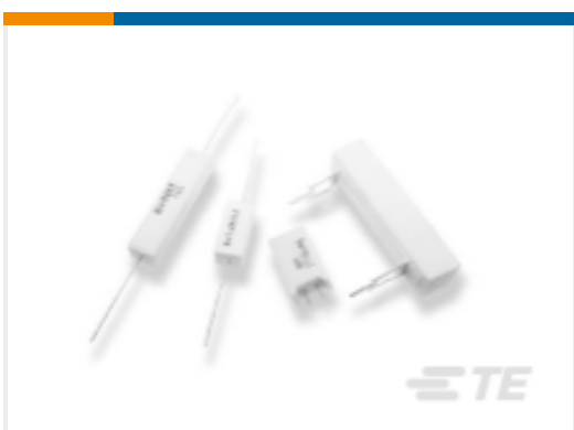
TE 产品编号1623795-9 线绕电阻器：水平安装