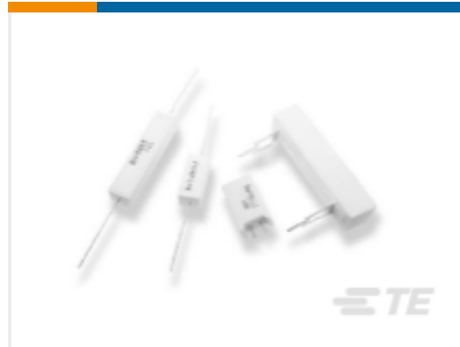
TE 产品编号1623795-9 线绕电阻器：水平安装