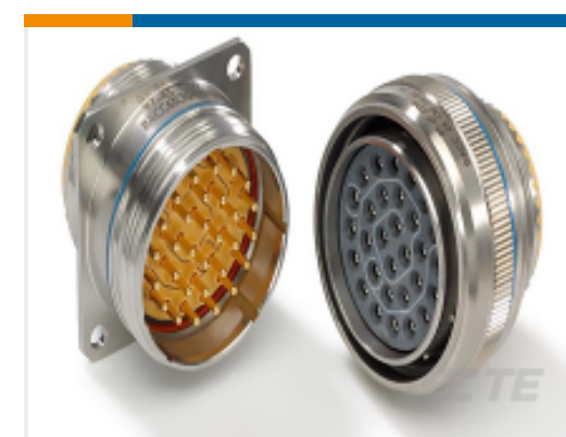
TE 产品编号ZPF000000000033222 983-0S 14-04 PN-L