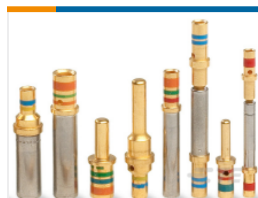
TE 产品编号ZPF000000000000335 006-0912-12 A