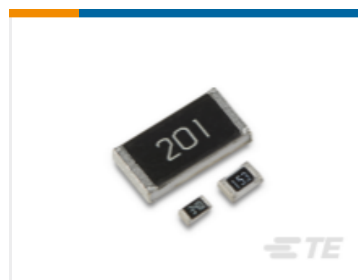
TE 产品编号2176326-4 CRGP 0603 18R 1%