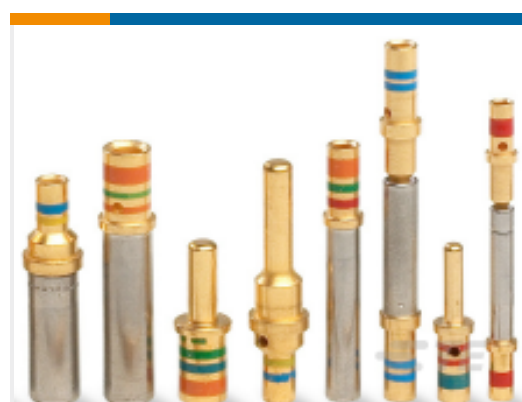
TE 产品编号ZPF000000000000358 006-0937-12 A