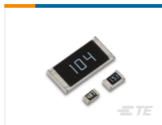
TE 产品编号1-2176345-4 CRGCQ 1210 120R 1%