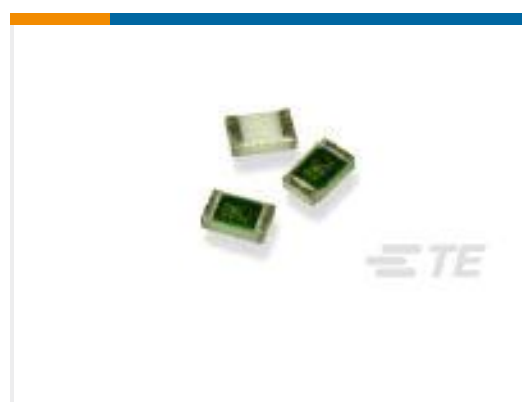
TE 产品编号8-1879334-1 CPF 0603 13R7 1% 50PPM 1K RL