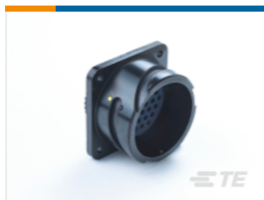
TE 产品编号Y5015-000000100131 FIXED PIN CONNECTOR