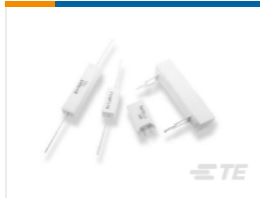
TE 产品编号1623795-9 线绕电阻器：水平安装