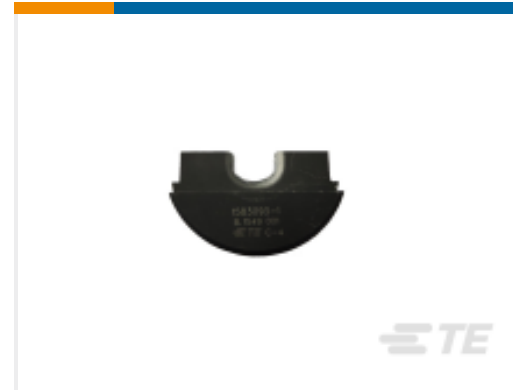
TE 产品编号1-1490413-6 NEST, 90 DEG SOLISTRAND, 4