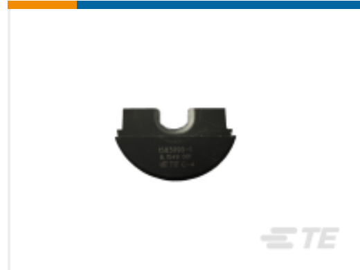
TE 产品编号1-1490413-8 NEST, 90 DEG SOLISTRAND1/0