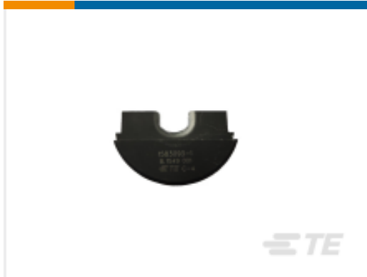
TE 产品编号1-1490413-6 NEST, 90 DEG SOLISTRAND, 4