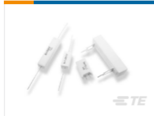
TE 产品编号1623795-9 线绕电阻器：水平安装