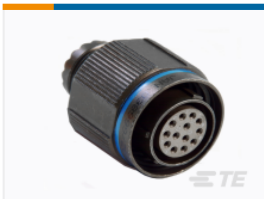
TE 产品编号YDTS26T19-35SNC001 PLUG ASSY