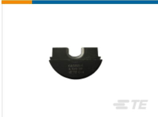
TE 产品编号1-1490413-8 NEST, 90 DEG SOLISTRAND1/0