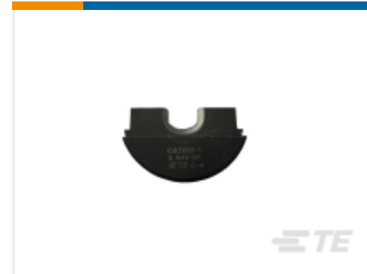
TE 产品编号1-1490413-6 NEST, 90 DEG SOLISTRAND, 4