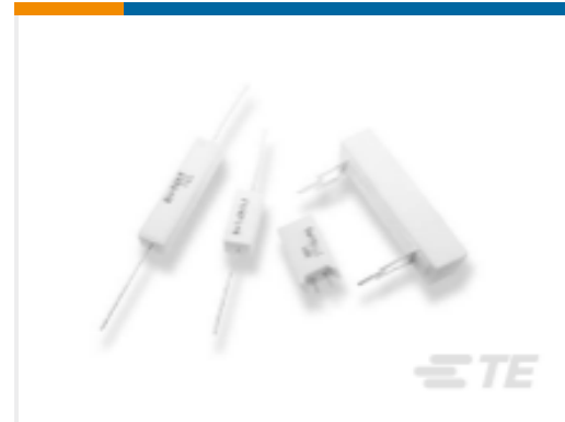
TE 产品编号1623795-9 线绕电阻器：水平安装