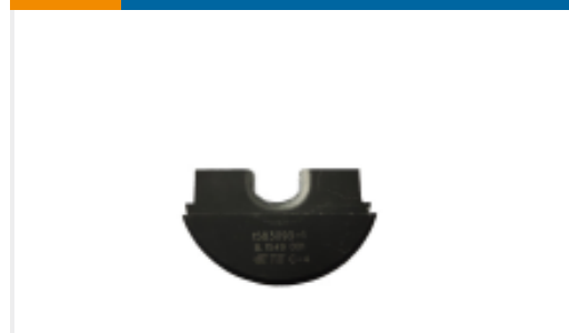
TE 产品编号1-1490413-8 NEST, 90 DEG SOLISTRAND1/0