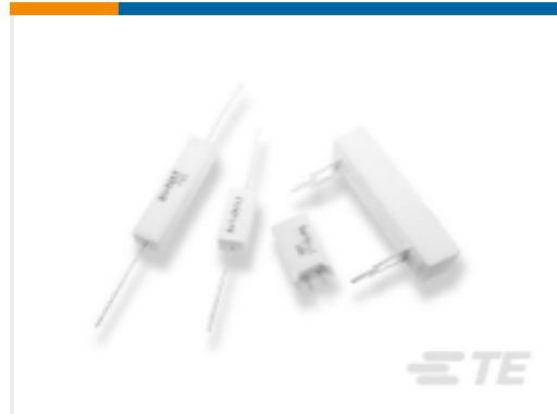
TE 产品编号1623795-9 线绕电阻器：水平安装