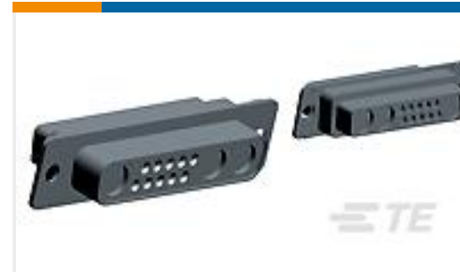
TE 产品编号208811-1 RECEPT ASSY,COAX MIX,AMPLIMITE