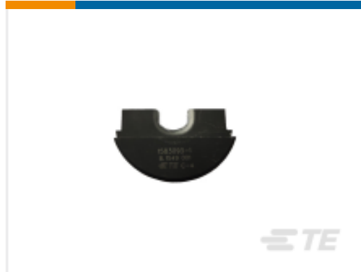
TE 产品编号1-1490413-8 NEST, 90 DEG SOLISTRAND1/0