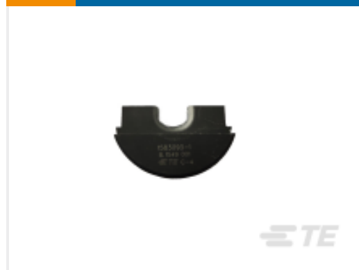
TE 产品编号1-1490413-8 NEST, 90 DEG SOLISTRAND1/0