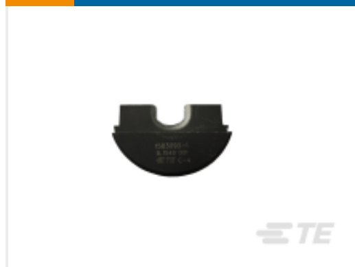
TE 产品编号1-1490413-6 NEST, 90 DEG SOLISTRAND, 4