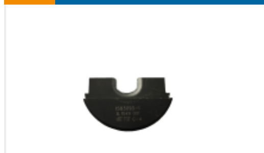
TE 产品编号1-1490413-6 NEST, 90 DEG SOLISTRAND, 4