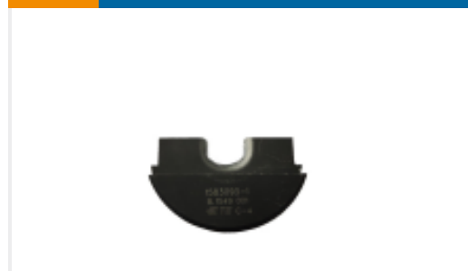
TE 产品编号1-1490413-8 NEST, 90 DEG SOLISTRAND1/0