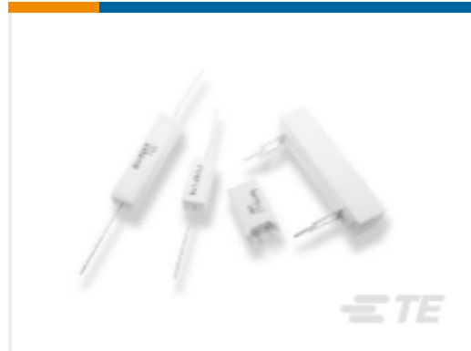
TE 产品编号1623795-9 线绕电阻器：水平安装