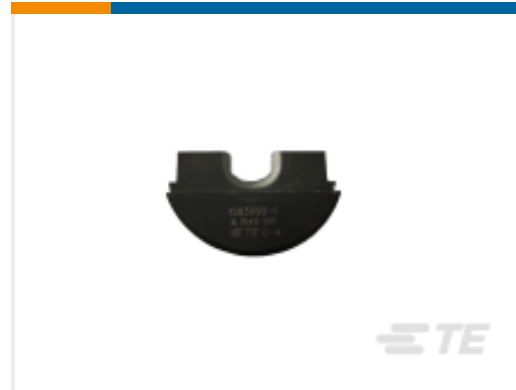
TE 产品编号1-1490413-6 NEST, 90 DEG SOLISTRAND, 4