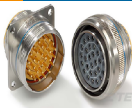
TE 产品编号ZPF000000000007174 983-ORS 08-98 PN