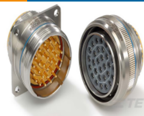
TE 产品编号ZPF0000000000007174 983-0RS 08-98 PN