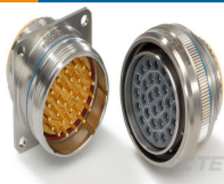
TE 产品编号358279-000 382C312-50-01-0