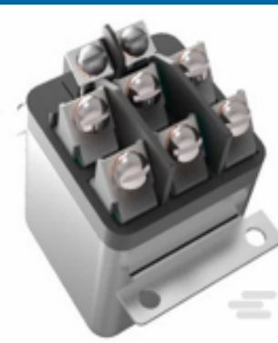
TE 产品编号1617807-5 FC-335-SY8= RELAY, 3PST