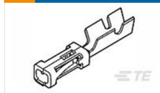
TE 产品编号85969-8 MOD IV RECP PLTD 30 SEL