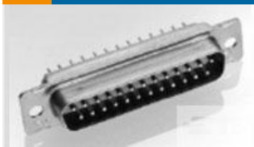
TE 产品编号205161-1 AMPLIMITE,ASY,RCPT,STD,109,1