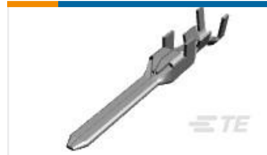
TE 产品编号175285-5 DYNAMIC D-3 TAB CONT. M PRE-TIN