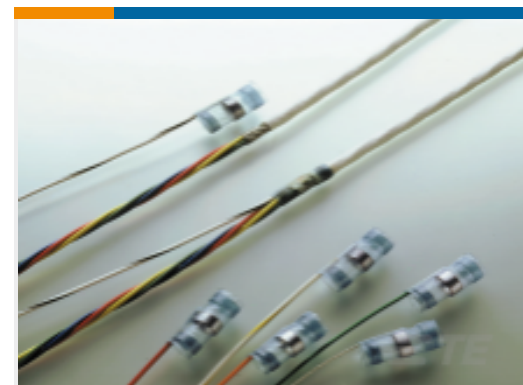
TE 产品编号060060N001 S02-20-R-3CS1093