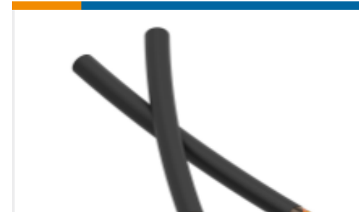
TE 产品编号NB14002001 TAT-125-1-0-STK