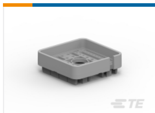
TE 产品编号WB-51SAL DEUTSCH DRB Wedgelocks