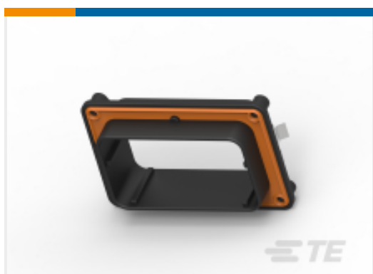
TE 产品编号DRBF-1B DEUTSCH DRB Mounting Accessories