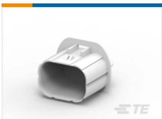
TE 产品编号2103414-1 SHIPPING CAP TYPE 1, PLUG, HVA280