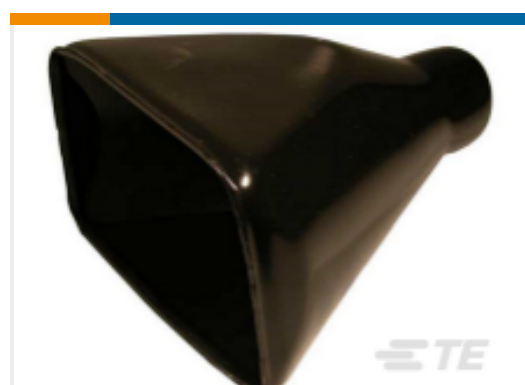
TE 产品编号DRB102-BT BOOT, 102P, PLG/REC, ST, BLK