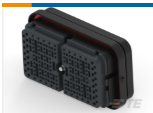
TE 产品编号DRB16-128SBE-L018 PLG, 128P, BLK, E, CAP, B