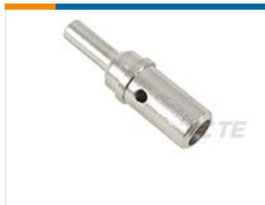
TE 产品编号0460-204-08141 PIN, SOLID, SIZE 8, 8-10AWG, NI