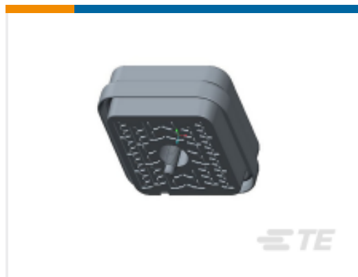
TE 产品编号DRB16-48SAE-L018 PLG, 48P, BLK, E, CAP, A