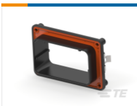
TE 产品编号DRBF-1B FLANGE, MOUNT, 102/128P, BLK, B