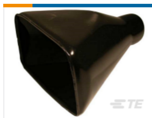
TE 产品编号DRB102-BT BOOT, 102P, PLG/REC, ST, BLK