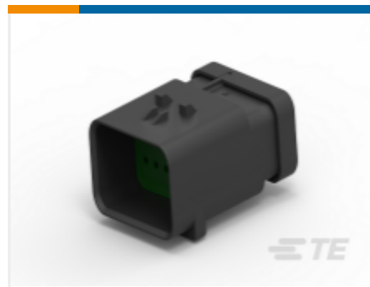
TE 产品编号1717677-4 CAP ASSY,12P,BRACKET REVERSE TYPE,ATAC C