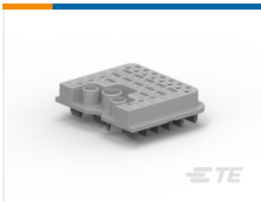
TE 产品编号WB-51SAL WEDGE LOCK, 102P, PLG, GRY, LF, DRB, A