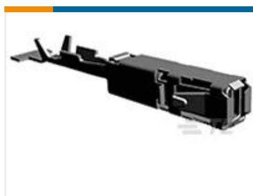
TE 产品编号1241381-3 AMP MCP 1.5K, CONTACT, SWS, (LP)