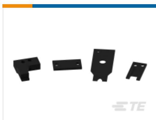
TE 产品编号659547-9 SCHNITTMESSER