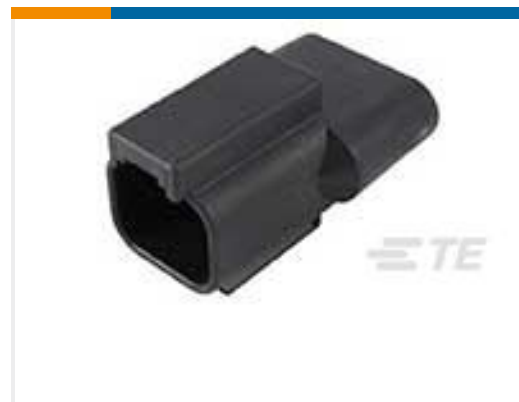
TE 产品编号DT04-2P-RT21 REC, 2P, BLK, 511 OHM RESISTOR, NI