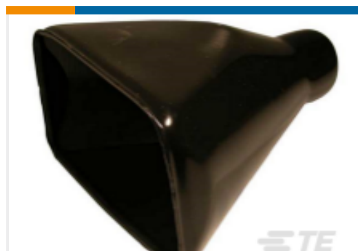
TE 产品编号DRB102-BT BOOT, 102P, PLG/REC, ST, BLK