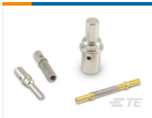
TE 产品编号0462-203-08141 DEUTSCH Solid Contacts