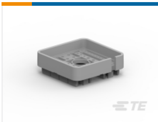
TE 产品编号WB-51PAL DEUTSCH DRB Wedgelocks