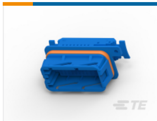
TE 产品编号1355469-3 1,6/2,8/5,8TAB-GH42