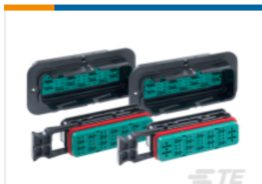
TE 产品编号2500022-1 SRC Pwr 60+6AG Male Blade Hsg Assy 2.5