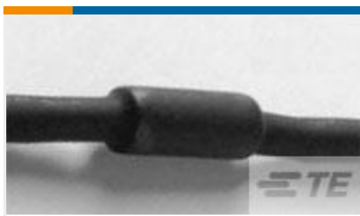
TE 产品编号A23899-000 TAT-125-1-0-1.5IN