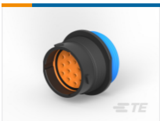
TE 产品编号2293822-1 HDP24-24-16PE-L024, REC, 16P, E, THD, 12,P