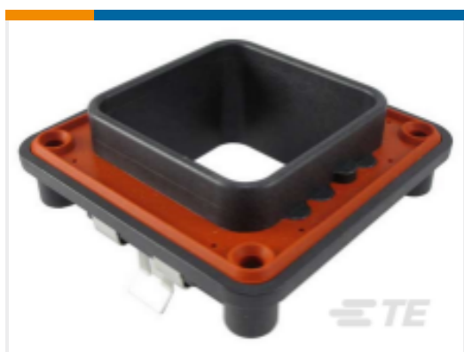
TE 产品编号DRBF-2B FLANGE, MOUNT, 60/48P, BLK, B