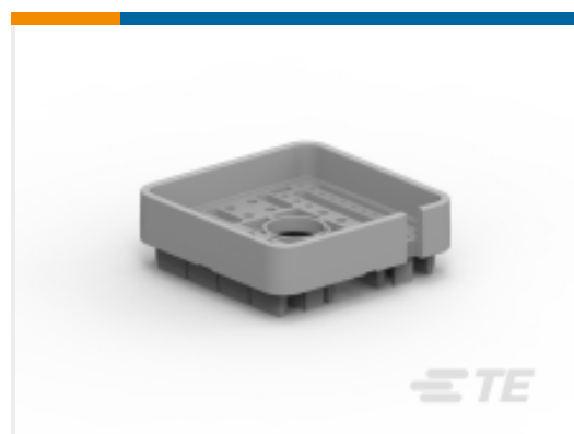
TE 产品编号WB-48SB DEUTSCH DRB Wedgelocks