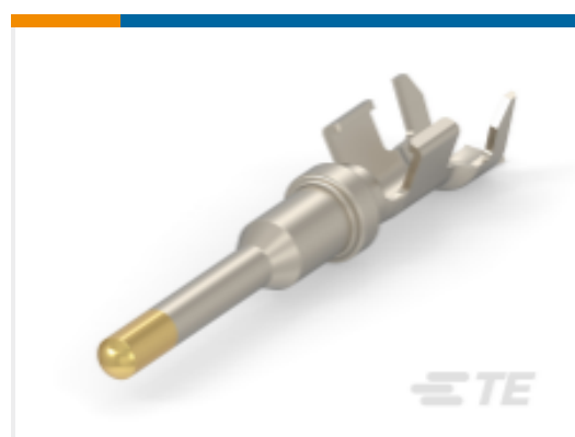
TE 产品编号1060-16-0144-PS PIN, SF, SIZE 16, 14-18, AU/SN, 100 PC