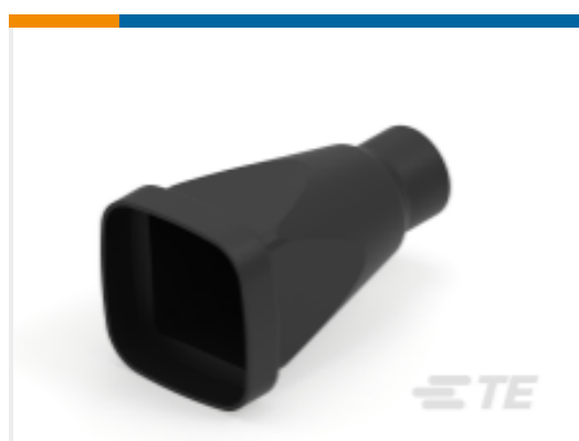
TE 产品编号DRB48-60-BT BOOT, 48/60P, PLG/REC, ST, BLK