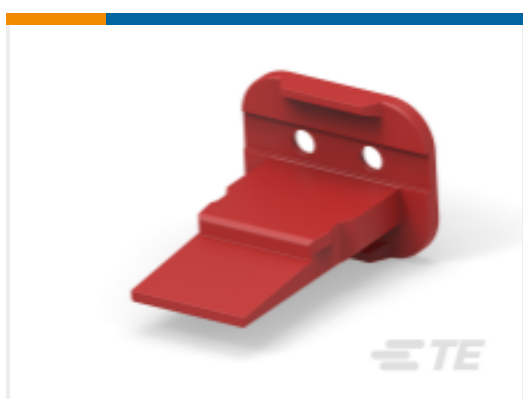
TE 产品编号W2S-P070-R SEAL RETN WEDGE.RED. DT 2 WAY.