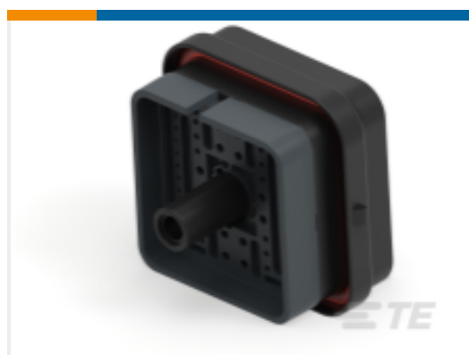
TE 产品编号DRB12-48PBE-L018 REC, 48P, BLK, E, CAP, B