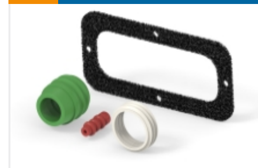
连接器密封件和盲堵(6)