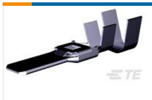
TE 产品编号1544333-1 LANGUETTE 8MM NG1