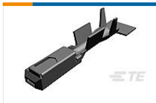
TE 产品编号1241608-6 MQS1,5 Ag rec CB unseal. 0,75-1,5