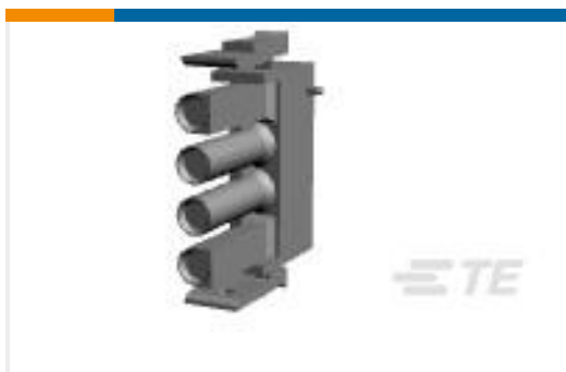
TE 产品编号926298-3 04P UNIV.M-N-L.PLUG