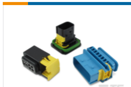
TE 产品编号2-1670894-1 重载密封系列连接器塑壳