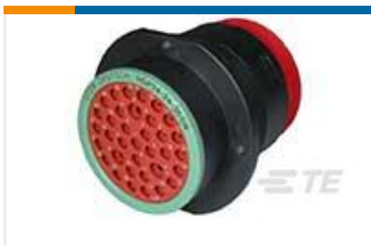
TE 产品编号HDP24-24-35SN REC, 35P, BLK, N, 16/20, S