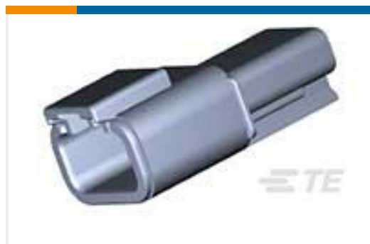
TE 产品编号DTMH04-3PA REC, 3P, BLK, N, HI TEMP, A