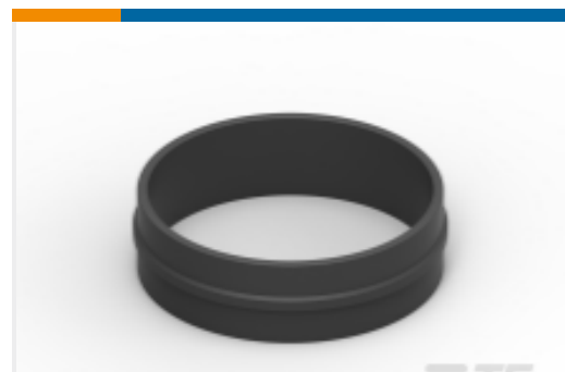
TE 产品编号1011-013-0405 SEAL RET, 4SZ, BLK, DTHD/DTCE