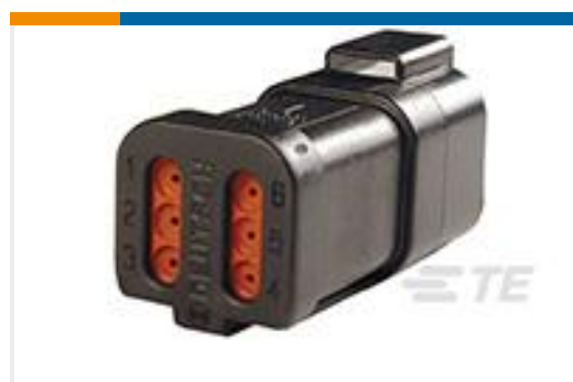
TE 产品编号DT04-6P-CE03 REC, 6P, BLK, E, CAP