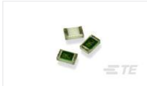
TE 产品编号7-1879215-1 CPF 0402 24K9 0.1% 25PPM 1K RL