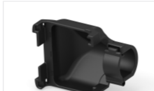
TE 产品编号776665-1 Wire Cover, V Type, 49 Position