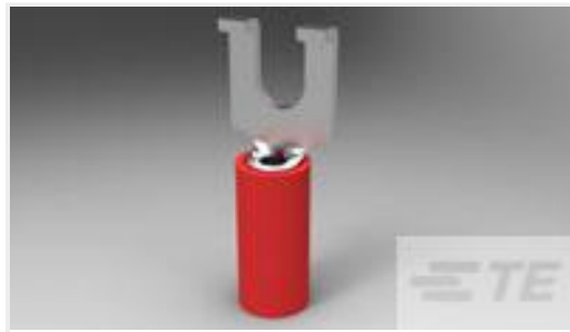
TE 产品编号32561 PIDG SPDFLG 22-16COMM22-18MIL6