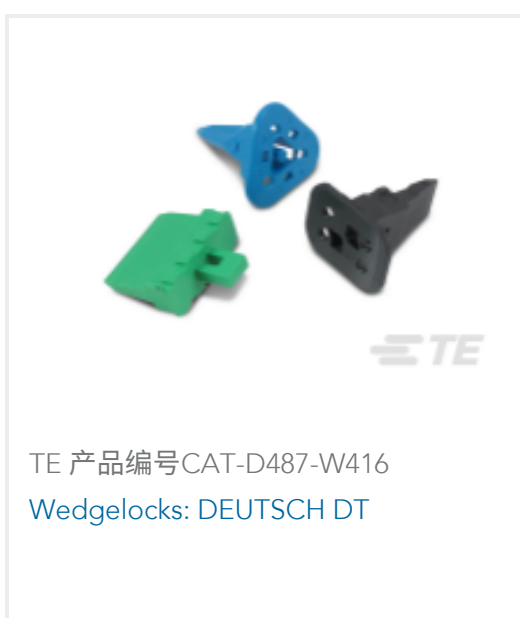
TE 产品编号CAT-D487-W416 WedgeLocks: DEUTSCH DT