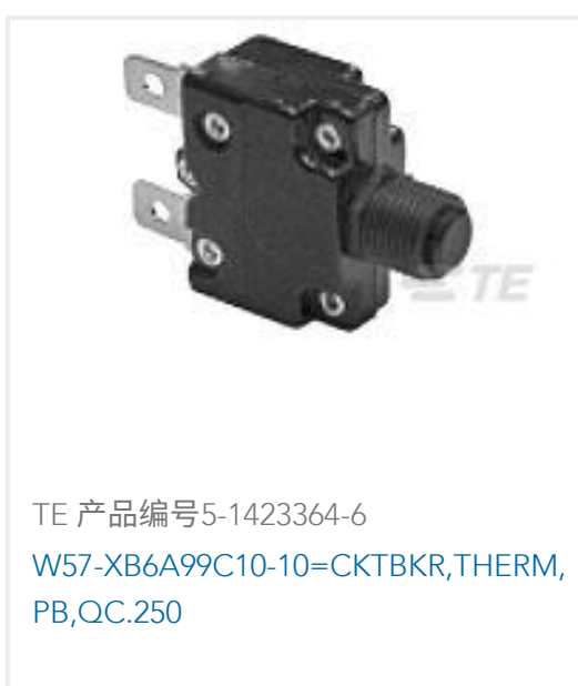
TE 产品编号5-1423364-6 W57-XB6A99C10-10=CKTBKR,THERM, PB,QC.250