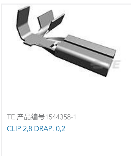
TE 产品编号1544358-1 CLIP 2,8 DRAP. 0,2