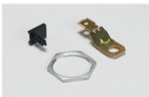
其他汽车连接器附件(28)