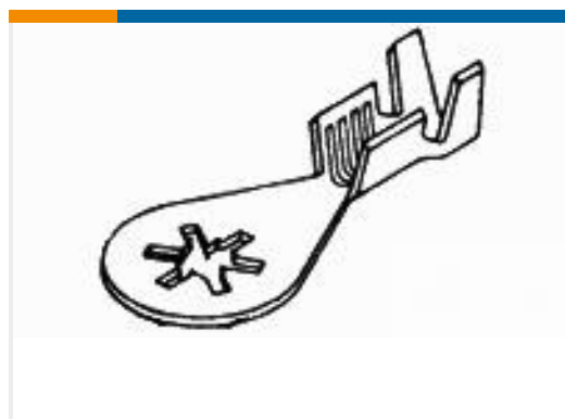
TE 产品编号61795-6 RING 18-14 AWG TPBR