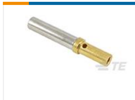
TE 产品编号0462-201-1631 SOC, SOLID, SIZE 16, 16-20AWG, AU