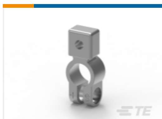
TE 产品编号HC5899 BAT CONNECTOR POS8MM AUXILLARY MNT