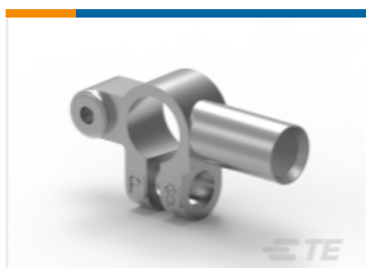
TE 产品编号HC5840D INTEGRAL BATT. POST. DOUBLE TAPER.