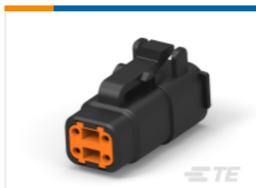
TE 产品编号DTMH06-4SA PLG, 4P, BLK, N, HI TEMP, A