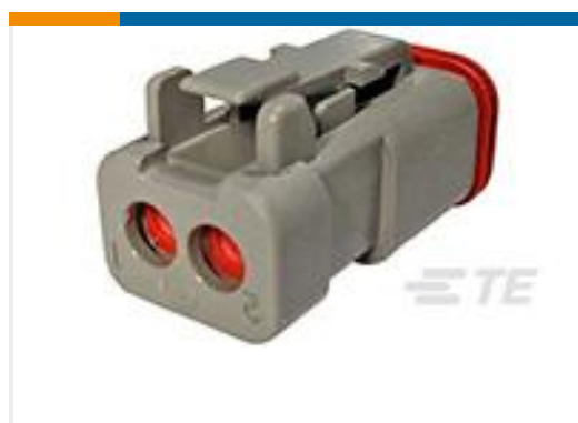
TE 产品编号DT06-2S-CE01 PLG, 2P, GRY, E, CAP