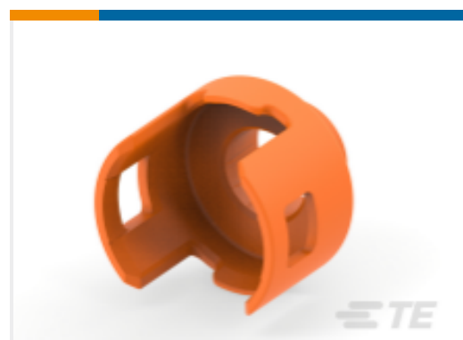
TE 产品编号2355153-3 WIRE COVER, IPT HD