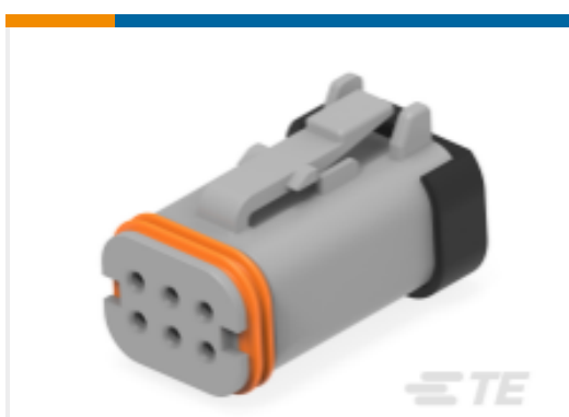
TE 产品编号DT16-6SA-KP01 PLG, 6P, GRY, E, A