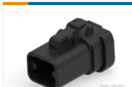
TE 产品编号DTP06-4S-CE03 PLG, 4P, BLK, E, CAP