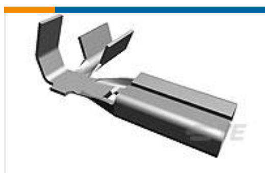
TE 产品编号1544358-1 CLIP 2,8 DRAP. 0,2