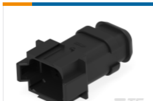
TE 产品编号DT04-08PA-CE09 REC, 8P, BLK, E, XCAP, A