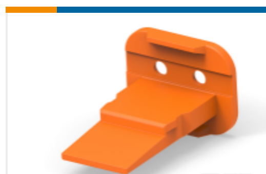
TE 产品编号W2S-P070-Y SEAL RETN WEDGE. ORANGE DT 2 W