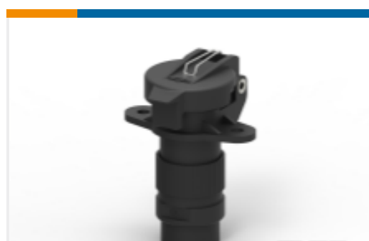
TE 产品编号CAR2SC68 CAR RECPT DIN9680 2way, IP68