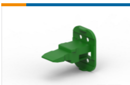
TE 产品编号W4SC-P012 WEDGE LOCK, 4P, PLG, GRN, SL RET, DT, C