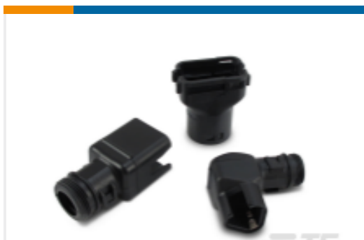
TE 产品编号1011-258-0205 DEUTSCH DT Backshells