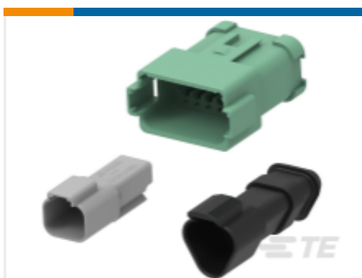
TE 产品编号DT04-6P DEUTSCH DT Receptacle Connectors