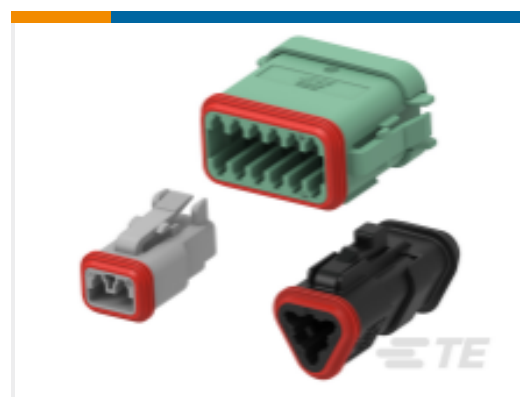
TE 产品编号DT06-6S DEUTSCH DT Plug Connectors