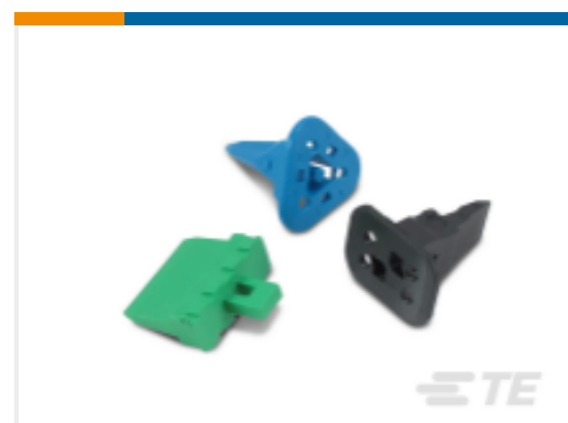
TE 产品编号W3S Wedgelocks: DEUTSCH DT