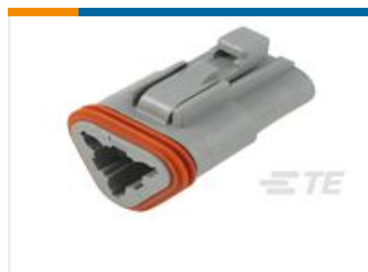
TE 产品编号DT06-3S PLG, 3P, GRY, N