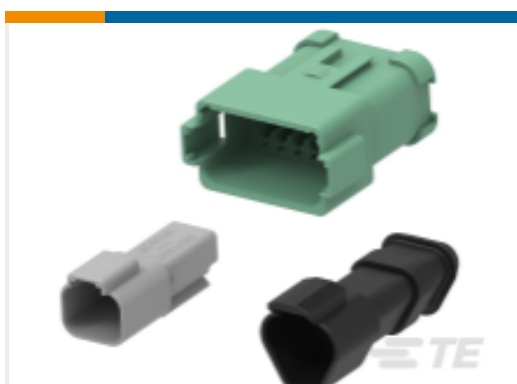
TE 产品编号DT04-6P DEUTSCH DT Receptacle Connectors