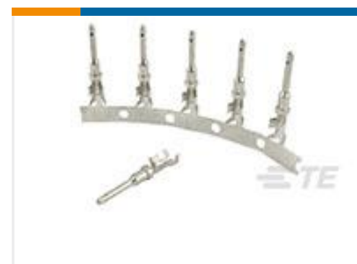
TE 产品编号1060-16-0122 PIN, SF, SIZE 16, 14-18, NI/SN