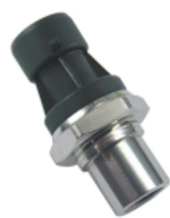
TE 产品编号 U7139-010BA-2W0000 PRESS XDCR U7139-010BA-2W0000