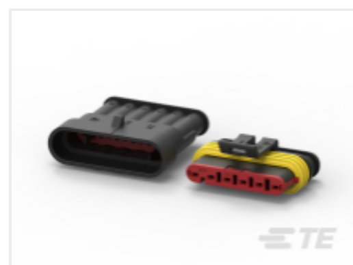
TE 产品编号CAT-AM71-CH8172 AMP SUPERSEAL 1.5MM, 连接器壳体