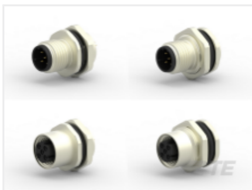
TE 产品编号 CAT-C73765-M1G M12 面板安装焊杯