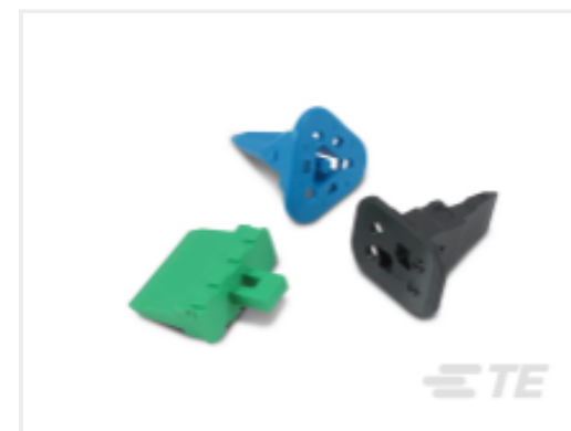
TE 产品编号CAT-D487-W416 Wedgelocks: DEUTSCH DT