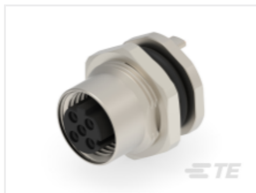
TE 产品编号 T4131512041-002 M12,REAR MOUNT,FEMALE,D,4P, SOLDER WIRE