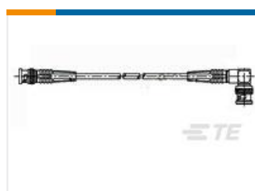
TE 产品编号1337772-1 50/OHM COAX BNC STR PLUG-ELB P