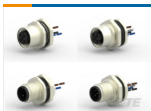
TE 产品编号T4171310504-001 M12 面板安装导线