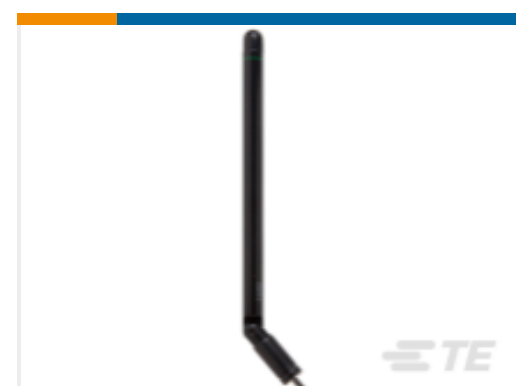
TE 产品编号ANT-315-PW-RA Antenna 1/4 Wave 315MHz Swivel Screw #6