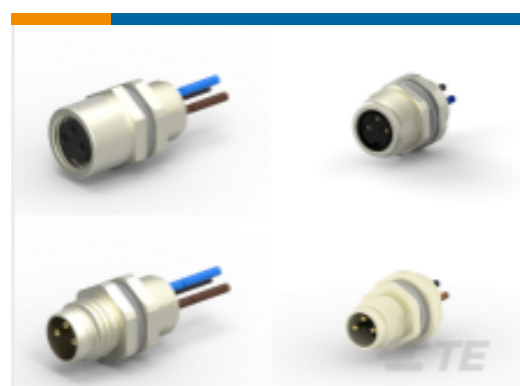
TE 产品编号T4072014041-001 M8 面板安装导线