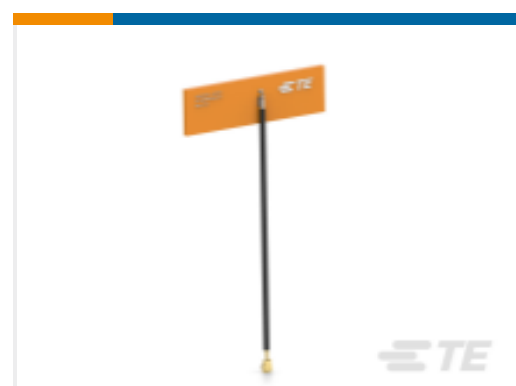
TE 产品编号2344654-2 WLAN DUAL BAND ANTENNA PCB V 100mm