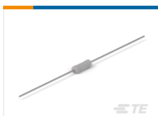
TE 产品编号5-1676123-3 1/2W SM M/OX 5% 120R