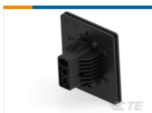
TE 产品编号2399992-1 KIT, 2P PLUG DOCKING, CHARGER