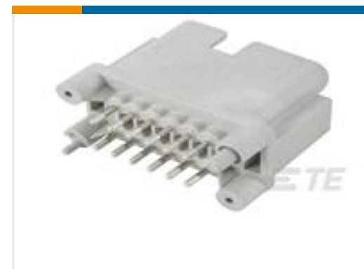
TE 产品编号DTF15-12PA HDR, 12P, GRY, ST, SN/NI/CU, A