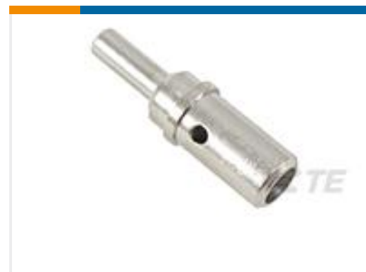
TE 产品编号0460-204-08141 PIN, SOLID, SIZE 8, 8-10AWG, NI