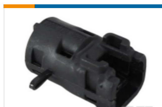
TE 产品编号1028-041-0205 BKSHL, 2P, BLK, PLG, ST, NW 8.5