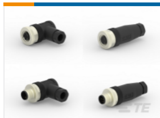
TE 产品编号T4112001051-000 M12 可现场安装非屏蔽式