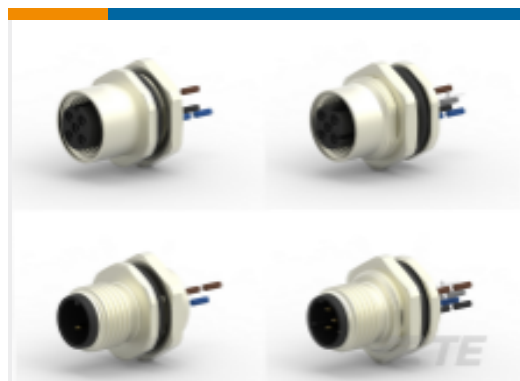
TE 产品编号T4171310005-001 M12 面板安装导线