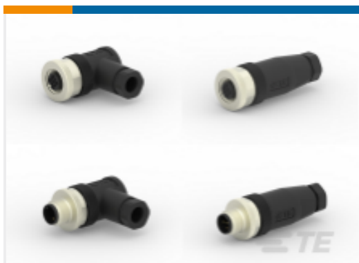
TE 产品编号T4110002031-000 M12 可现场安装非屏蔽式