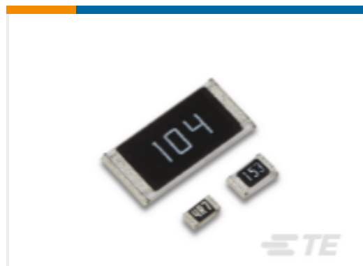
TE 产品编号2-2176345-6 CRGCQ 1210 1K2 1%