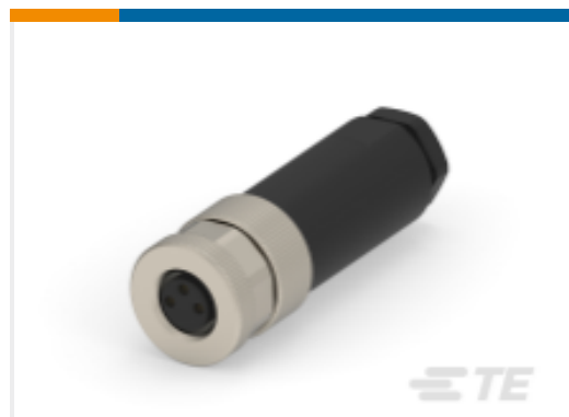
TE 产品编号T4010008031-000 M8,SCREW, FEMALE,S,UNSHIELD,3P, GOLD