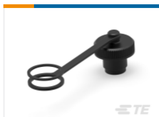
TE 产品编号2823065-1 M12-DUST CAP-FEMALE CONN-IP67- WIT SLEEVE