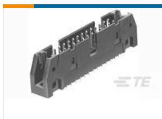
TE 产品编号2-1761679-1 IDC LOW PRO HDR 6P VERT BLUE