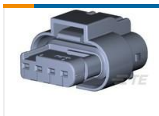
TE 产品编号1-1456426-1 4POS, MCON 1.2 CB REC 2p TL SEALED