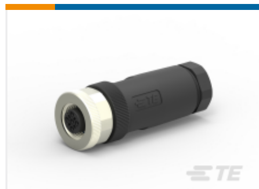
TE 产品编号T4110002031-000 M12,FEMALE,STRAIGHT,A CODE,3P, PG9,GOLD