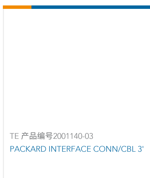
TE 产品编号2001140-03 PACKARD INTERFACE CONN/CBL 3'