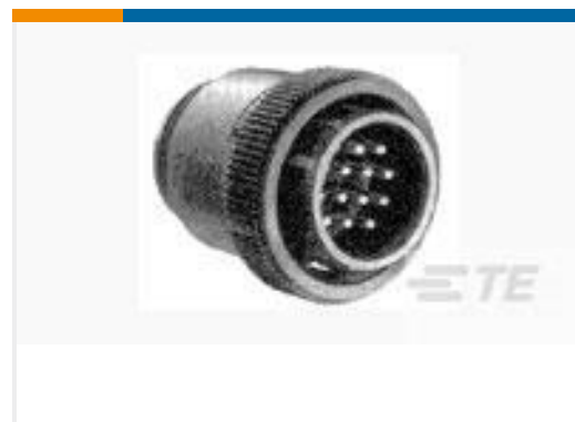
TE 产品编号206044-1 CPC PLUG ASSEMBLY SIZE 17-14