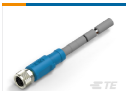
TE 产品编号T4061320004-004 M8 CABLE ST FEMALE 3M 4POS PUR CABLE