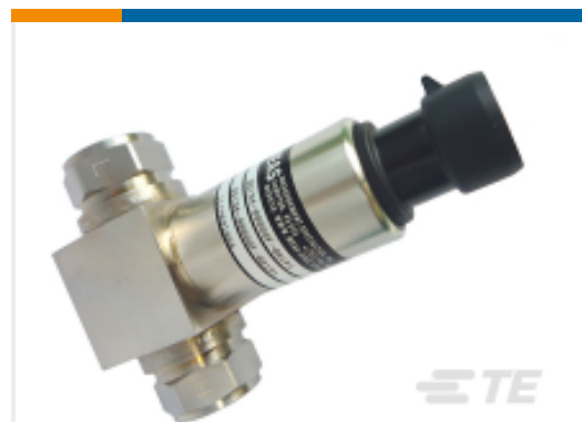
TE 产品编号D5154-000005-005PD Differential Pressure Transducer