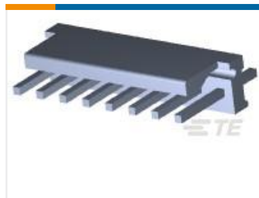
TE 产品编号644752-8 08P MTA156 HDR ASSY SQ STR F/L