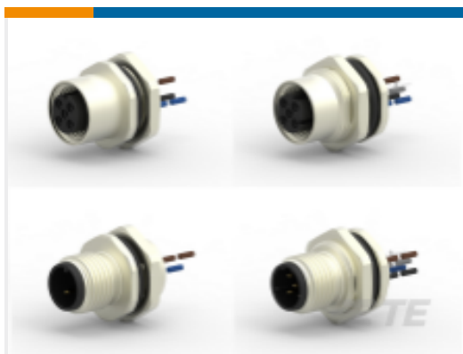
TE 产品编号T4171110003-001 M12 面板安装导线