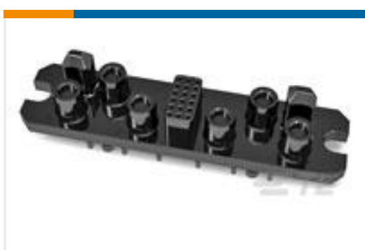
TE 产品编号6651810-1 294-0091-01100=SA CONN,SKT