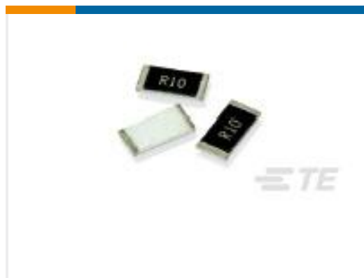
TE 产品编号1-2176055-8 RLP73N 2B R051 1% 1K RL