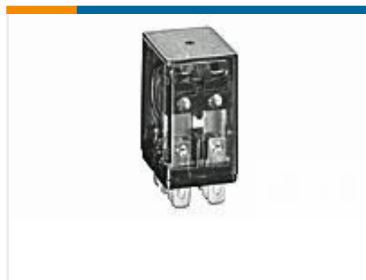
TE 产品编号6-1393144-8 K10P-11D55-24=K10/K20