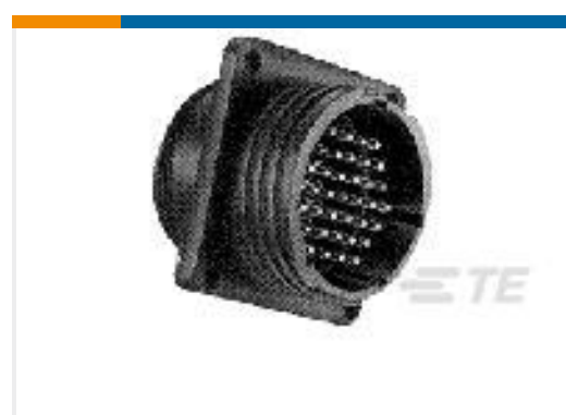
TE 产品编号208130-1 CPC RECPT ASSEMBLY SIZE 11-4