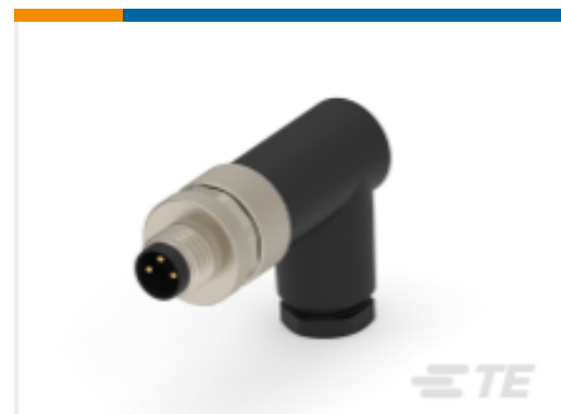
TE 产品编号T4013008031-000 M8, SCREW, MALE, R/A, UNSHIELD, 3P, GOLD