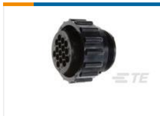
TE 产品编号206037-1 CPC PLUG ASSEMBLY SIZE 17-16