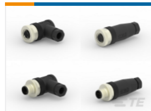
TE 产品编号T4113002081-000 M12 可现场安装非屏蔽式