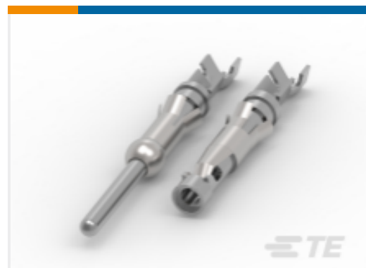
TE 产品编号1-66105-9 Pin and Socket Contacts, Type III, LP