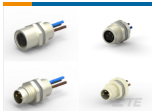
TE 产品编号T4070014031-001 M8 面板安装导线