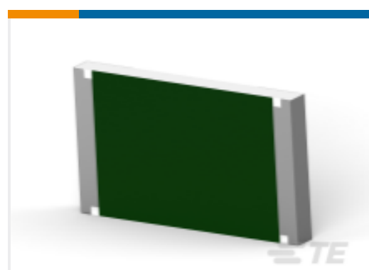
TE 产品编号2-2176408-1 3560 12K 5%