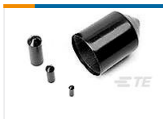
TE 产品编号843056-000 101A073-3-0