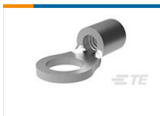
TE 产品编号34126 TERMINAL,SOLIS R 16-14 3/8