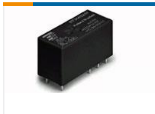
TE 产品编号3-1393237-1 RTE24012F