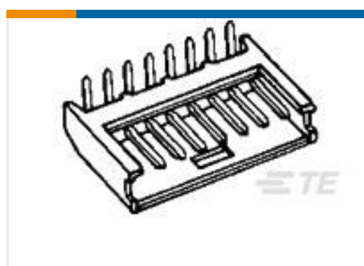
TE 产品编号280381-1 10P MODU II SHRD HDR, RT ANG, TIN