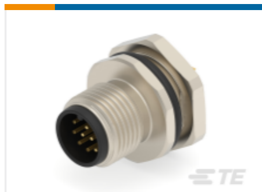
TE 产品编号T4132012121-000 M12,FRONT MOUNT,MALE,A,12P, SOLDER WIRE