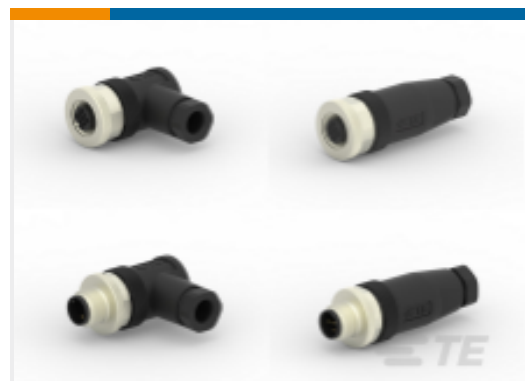
TE 产品编号T4111001031-000 M12 可现场安装非屏蔽式