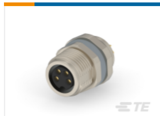
TE 产品编号T4031017041-000 M8.FMLE.PNLREAR.4POS.STR