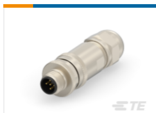
TE 产品编号T4111012051-000 M12 M, 5P GOLD A_CODE S SHIELDED PG9