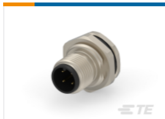
TE 产品编号T4171010004-001 M12,REAR MOUNTING,MALE,A,4P,0.2 M WIRE