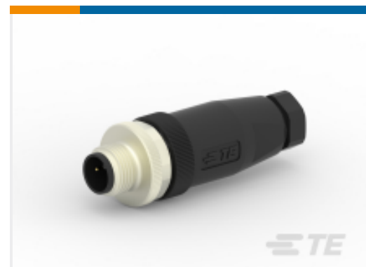
TE 产品编号T4111001021-000 M12,MALE,STRAIGHT,A CODE,2P, PG7,GOLD