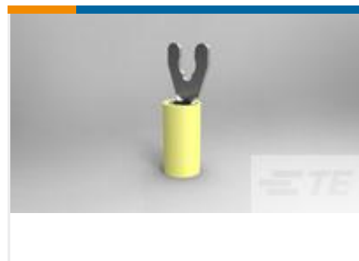
TE 产品编号52942 TERMINAL,PIDG SPR SPD 12-10 8