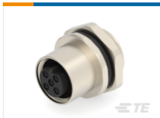
TE 产品编号T4133412021-000 M12,FRONT MOUNT,FEMALE,B,2P, SOLDER WIRE