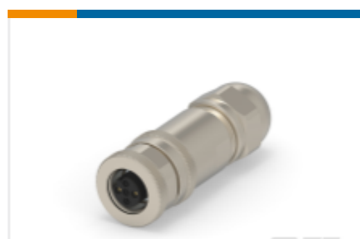
TE 产品编号T4110411021-000 M12 F 2P B_CODE S SHIELDED PG7 GOLD