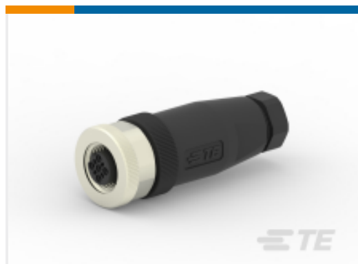
TE 产品编号T4110401031-000 M12,FEMALE,STRAIGHT,B CODE,3P, PG7,GOLD