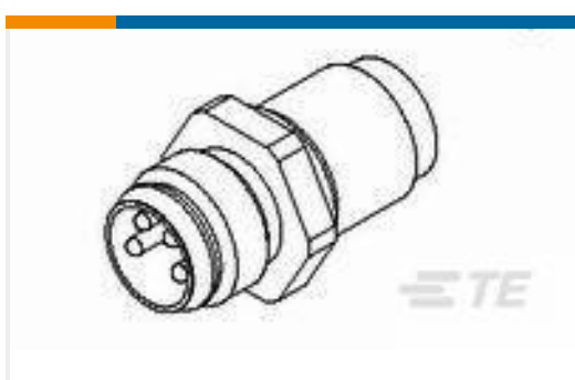
TE 产品编号2273230-1 M8 Male Panel Mld Rear Mt M8 fast pig