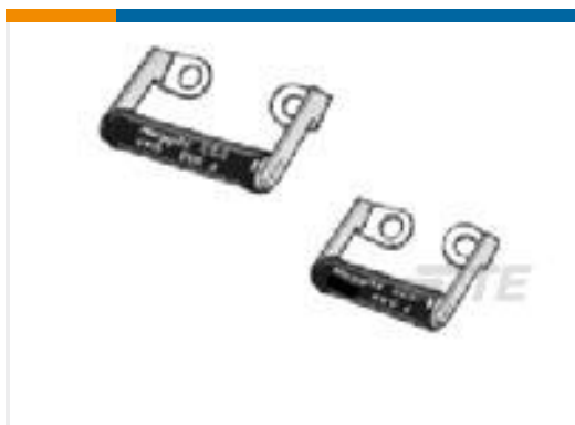
TE 产品编号1630184-9 YP10 47K 5%