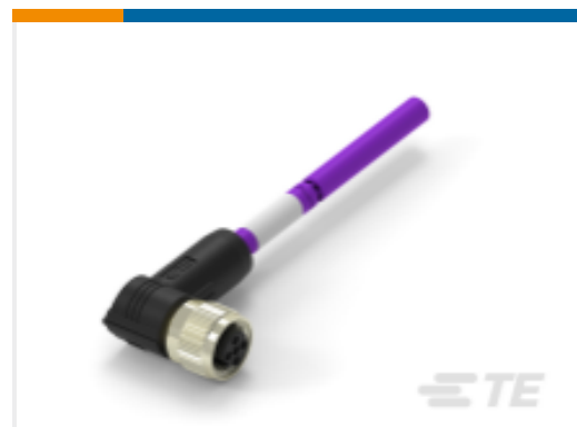
TE 产品编号TAB62435501-001 M12B2-FR-PUR-0.5M