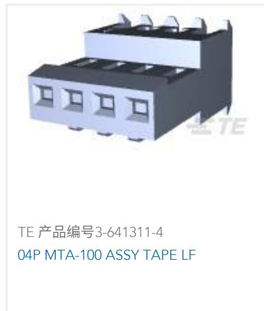
TE 产品编号3-641311-4 04P MTA-100 ASSY TAPE LF