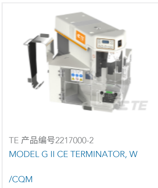
TE 产品编号2217000-2 MODEL G II CE TERMINATOR, W /CQM