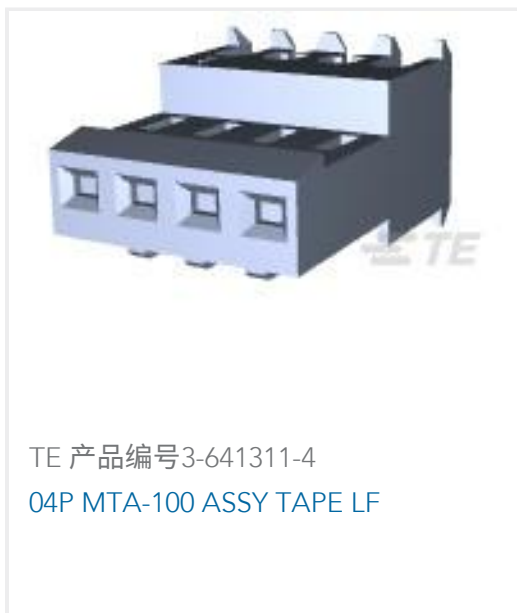
TE 产品编号3-641311-4 04P MTA-100 ASSY TAPE LF