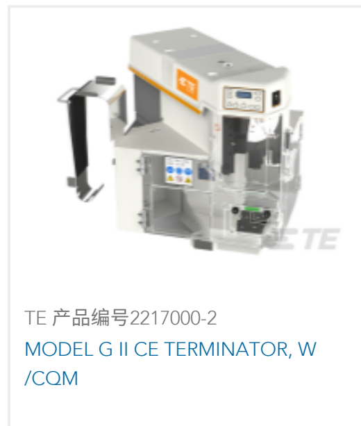
TE 产品编号2217000-2 MODEL G II CE TERMINATOR, W /CQM