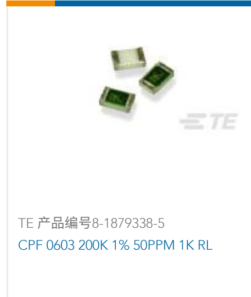
TE 产品编号8-1879338-5 CPF 0603 200K 1% 50PPM 1K RL