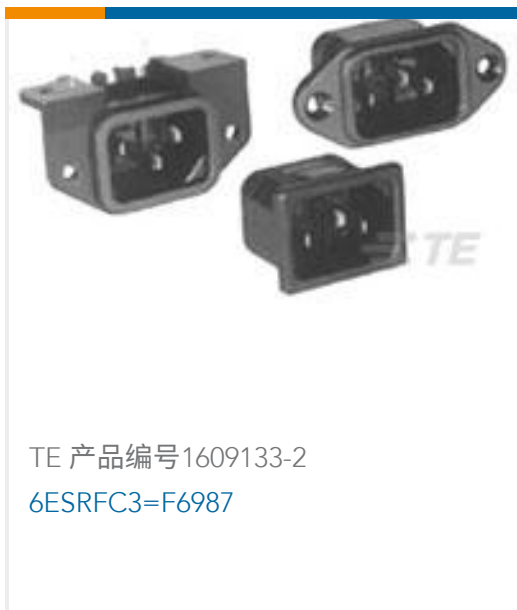
TE 产品编号1609133-2 6ESRFC3=F6987