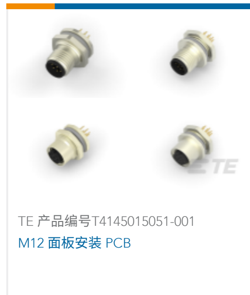
TE 产品编号T4145015051-001 M12 面板安装 PCB