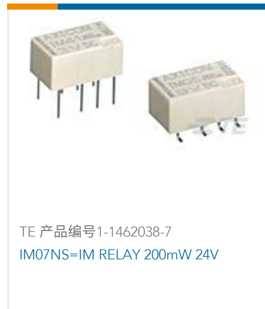
TE 产品编号1-1462038-7 IM07NS=IM RELAY 200mW 24V