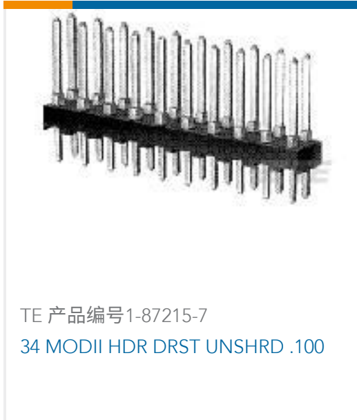
TE 产品编号1-87215-7 34 MODII HDR DRST UNSHRD .100