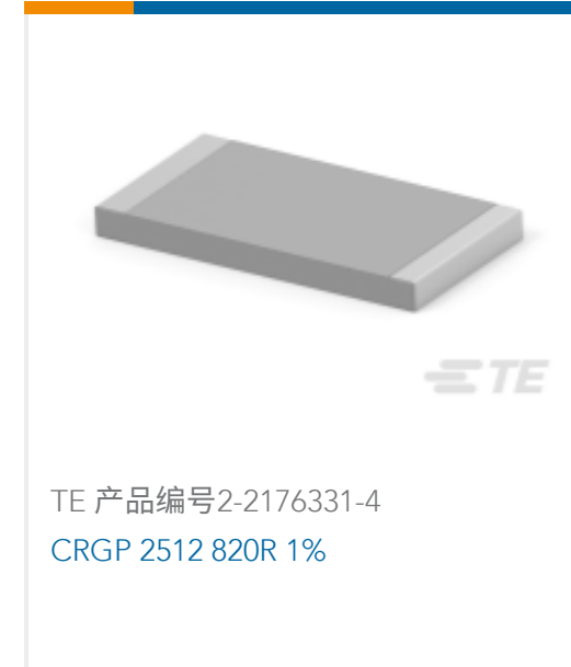
TE 产品编号2-2176331-4 CRGP 2512 820R 1%