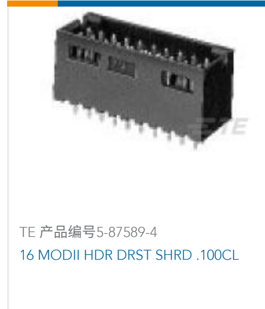
TE 产品编号5-87589-4 16 MODII HDR DRST SHRD .100CL