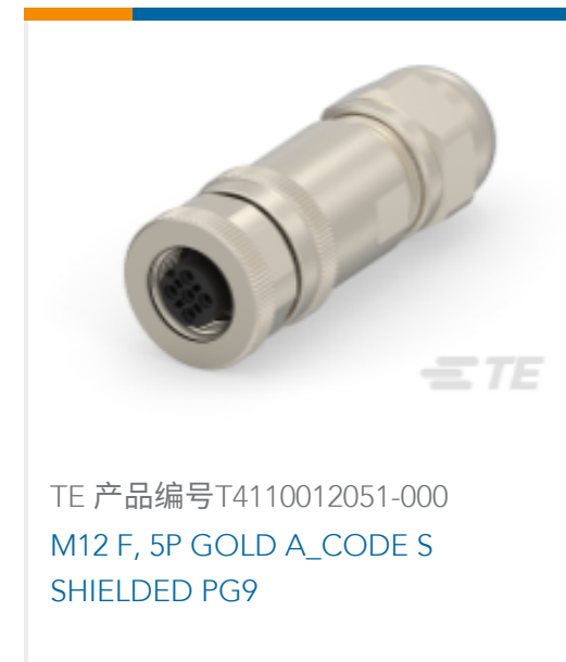
TE 产品编号T4110012051-000 M12 F, 5P GOLD A_CODE S SHIELDED PG9