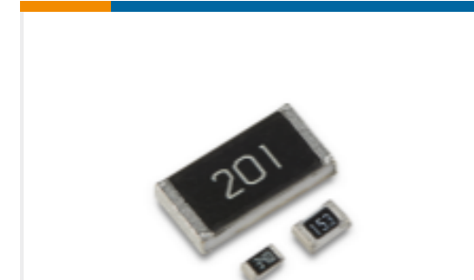
TE 产品编号1-2176326-3 CRGP 0603 100R 1%