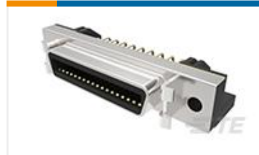
TE 产品编号5917738-4 CHAMP 050 FMS REC HDR ASSY 26P