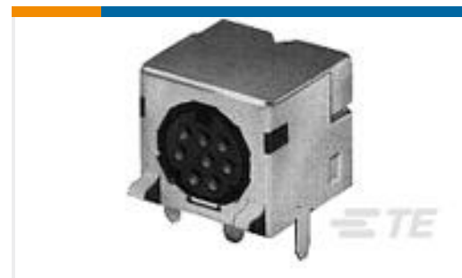
TE 产品编号5750069-1 Mini DIN, 4 pos, R/A, Shield