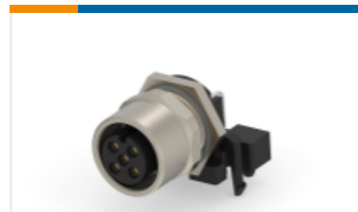
TE 产品编号T4145015041-001 M12 R/A F PNLREAR STAMPED PIN A-CODE 4P