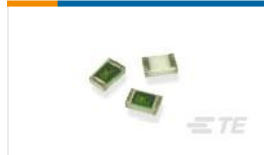
TE 产品编号6-2176094-0 RP 2A 0.25W 499K 0.1% 25PPM 1K RL