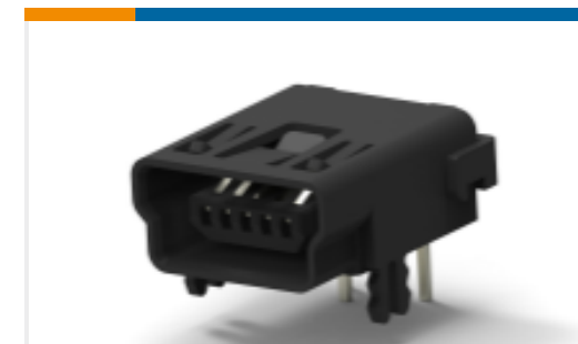
TE 产品编号1734510-1 MINI USB, TYPE B, R/A, T/H