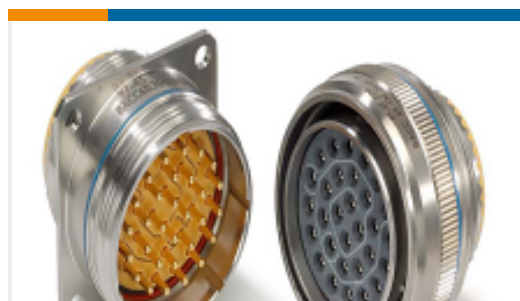
TE 产品编号ZPF0000000000007174 983-ORS 08-98 PN