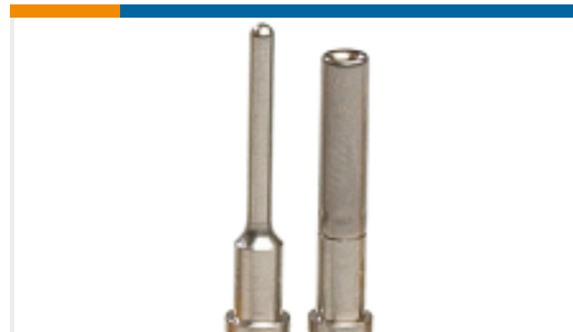
TE 产品编号ZPF000000000001261 097-0267-16 A1267