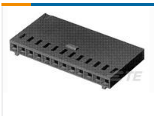
TE 产品编号102241-1 03 MODIV HSG COMP SR .100 POL