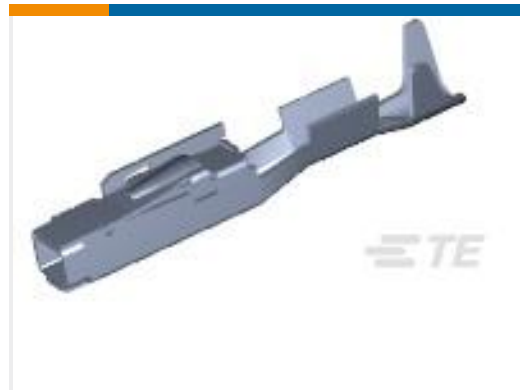
TE 产品编号7-1452656-3 MCON 1.2 LL REC SRC AG