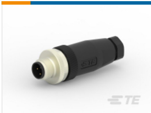
TE 产品编号T4111001031-000 M12,MALE,STRAIGHT,A CODE,3P, PG7,GOLD