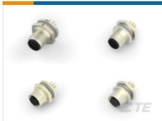
TE 产品编号T4141512041-000 M12 面板安装 PCB