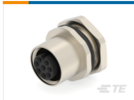
TE 产品编号T4133012081-000 M12,FRONT MOUNT,FEMALE,A,8P, SOLDER WIRE