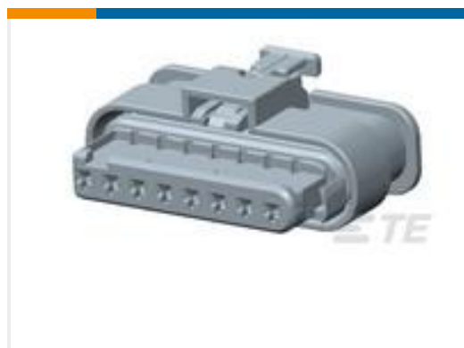
TE 产品编号1-1719393-1 8POS, MCON 1.2 LL REC SEALED