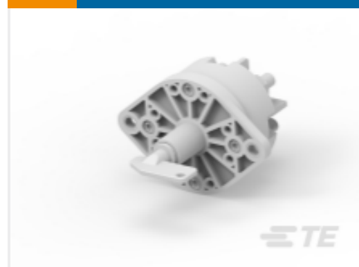
TE 产品编号K1124808 Battery Disconnect 35-524-100-R