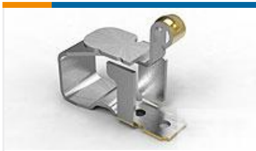
TE 产品编号1551575-5 Shield Finger, Loose Piece