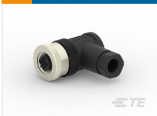
TE 产品编号T4112401051-000 M12,FEMALE,RA,B CODE,5P,PG7, GOLD