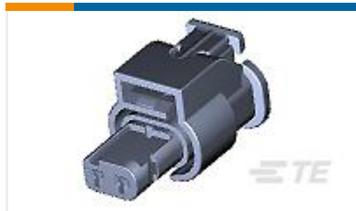
TE 产品编号3-1718643-1 2POS, MCON 1.2 LL REC SEALED