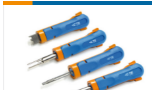
TE 产品编号234912-1 EXT TOOL FOR POWER DBL LOK REC