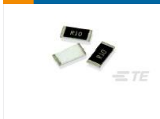
TE 产品编号1-2176057-9 RLP73N 3A R056 1% 1K RL