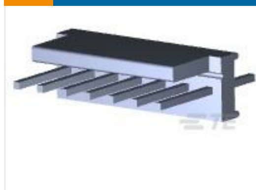
TE 产品编号640454-7 07P MTA100 HDR ASSY SQ STR POL