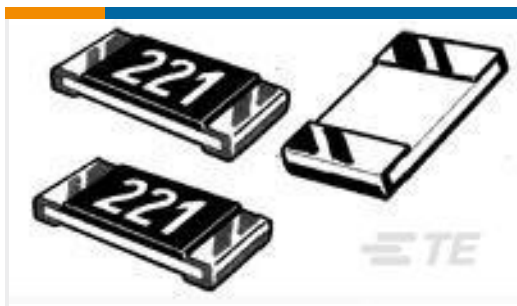
TE 产品编号4-1622820-1 3520 390R 5%