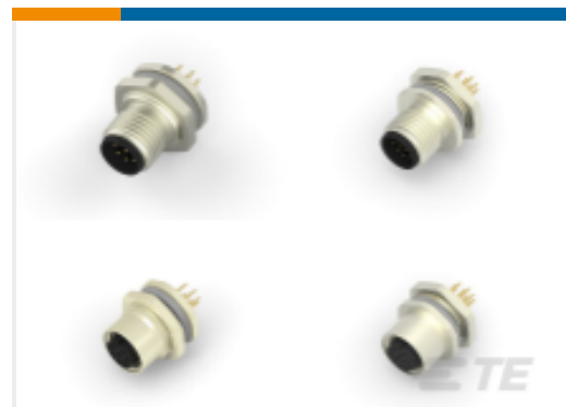
TE 产品编号T4140012021-000 M12 面板安装 PCB