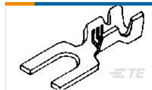
TE 产品编号60389-1 SPADE CRIMP 20-16 AWG BR