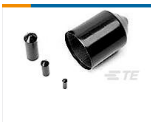
TE 产品编号843052-000 101A052-3-0