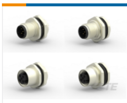
TE 产品编号T4131012041-000 M12 面板安装焊杯