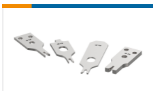
TE 产品编号1633872-4 CRIMPER, WIRE "O"