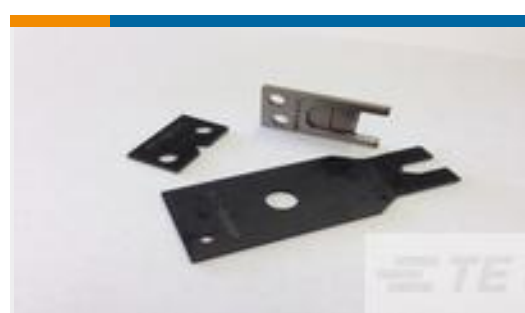
TE 产品编号1-2217206-3 Blade, Slug