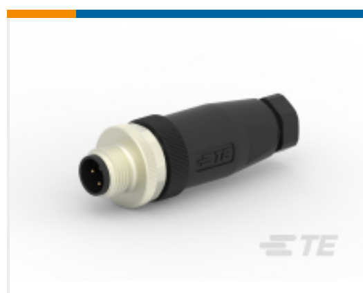
TE 产品编号T4111001031-000 M12,MALE,STRAIGHT,A CODE,3P, PG7,GOLD