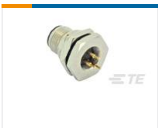
TE 产品编号1838893-1 M12 Mtl MALE PNL CONN. Sldr Re