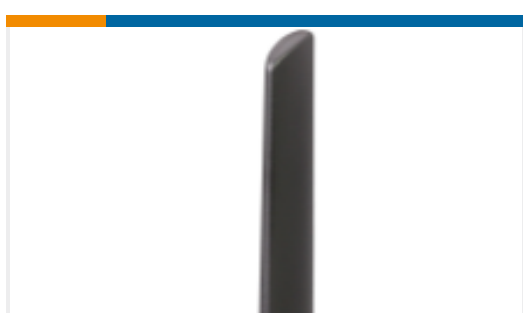
TE 产品编号ANT-5GWWS6-SMA Antenna Dipole Blade 5G/LTE Swivel SMA