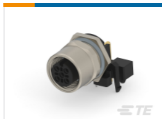
TE 产品编号T4145035041-001 M12 R/A F PNL STAMPED PIN A- CODE 4P SHLD