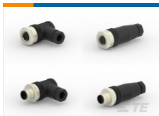
TE 产品编号T4110001021-000 M12 可现场安装非屏蔽式