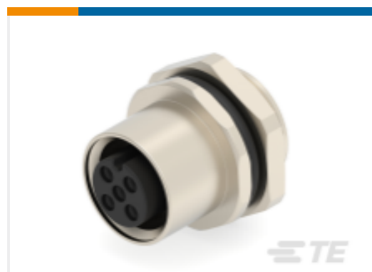
TE 产品编号T4133012031-000 M12,FRONT MOUNT,FEMALE,A,3P, SOLDER WIRE