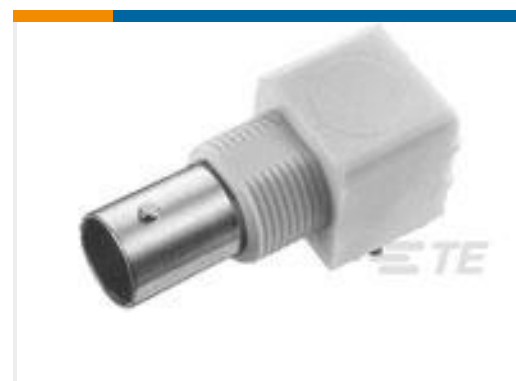
TE 产品编号5227161-2 RTANG JK W/MTG PINS, BNC PCB