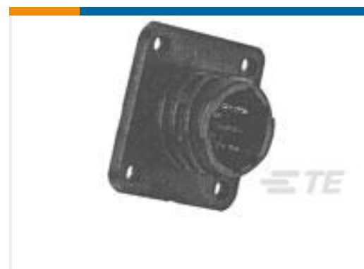
TE 产品编号205841-1 CPC RECPT ASSEMBLY SIZE 11-8