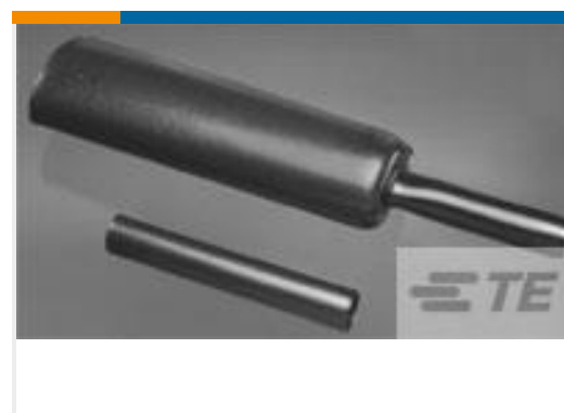
TE 产品编号420494-000 RMW-50/16-1200/ADH-0