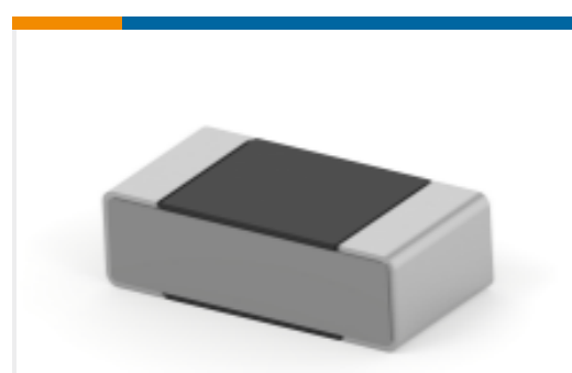
TE 产品编号1-2176280-2 CPF 0402 133K 0.1% 25PPM 1K RL