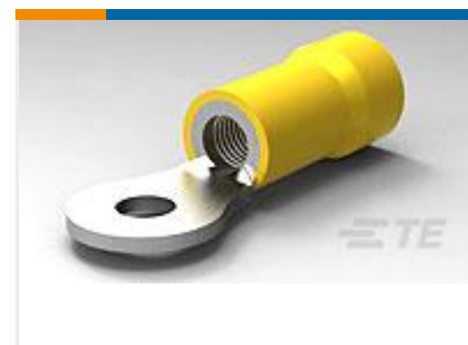
TE 产品编号34853 TERMINAL,PG R 12-10 8