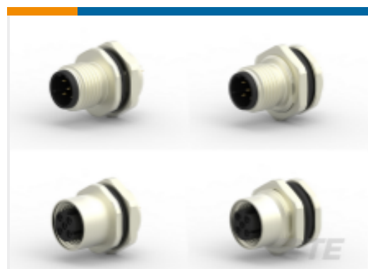
TE 产品编号T4131012051-000 M12 面板安装焊杯